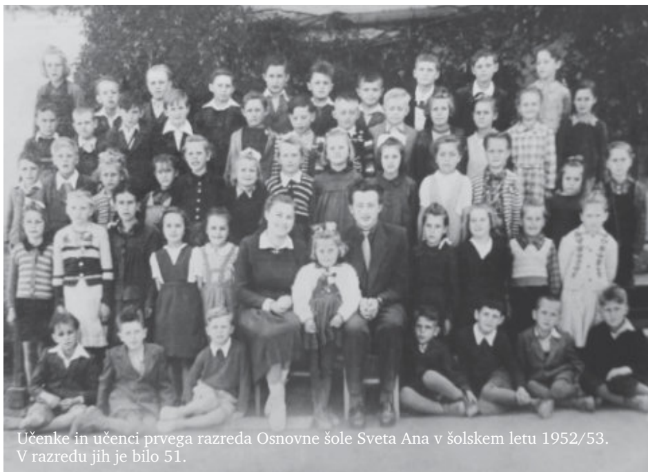
Učenke in učenci prvega razreda Osnovne šole Sveta Ana v šolskem letu 1952/53. V razredu jih je bilo 51.