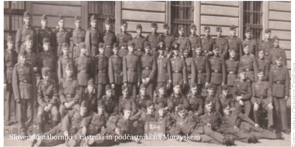
Slovenski naborniki s častniki in podčastniki na Moravskem