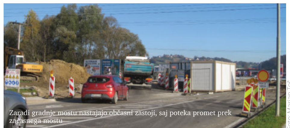
Zaradi gradnje mostu nastajajo občasni zastoji, saj poteka promet prek začasnega mostu

Novi most bo sodobno grajen in bo ustrezal vsem zdajšnjim standardom in normativom, zlasti glede njegove nosilnosti, kar ni nepomembno, saj so obremenitve na tej regionalni cesti vse večje. V okviru izgradnje bodo uredili primerne površine tudi za pešce in kolesarje. To je pomembno zaradi navezanosti na kolesarsko pot iz Lenarta proti Sveti Trojici in Benediktu. Naj ob tem zapišemo, da tudi sicer na veliko urejajo kolesarske povezave na celotnem območju osrednjih Slovenskih goric. Dela so v polnem teku, še zlasti v občinah Sveta Trojica, Lenart in Sveti Jurij v Slovenskih goricah. Vrednost gradbenih del novega mostu čez reko Velko znaša skoraj 1,5 milijona evrov, gradbena dela pa izvaja podjetje MARKOMARK NIVAL, d. o. o.