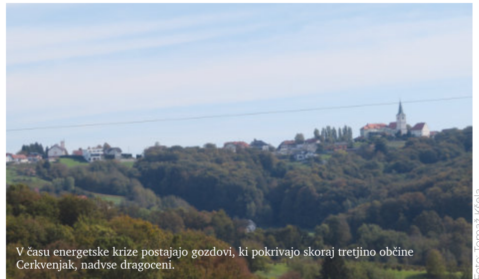
V času energetske krize postajajo gozdovi, ki pokrivajo skoraj tretjino občine Cerkevjak, nadvse dragoceni.

Po oceni strokovnjakov vsi uporabniki na območju občine Cerkevjak porabijo 11.758 MWh energije, od tega 7835 MWh iz biomase (66,6 odstotka), 1930 MWh iz ekstra lahkega kurilnega olja (16,4 odstotka), 899 MWh iz utekočinjenega