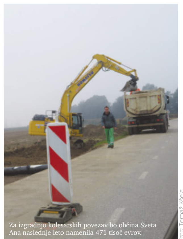
Za izgradnjo kolesarskih povezav bo občina Sveta Ana naslednje leto namenila 471 tisoč evrov.

Iz načrta razvojnih programov je razvidno, da bo Občina Sveta Ana naslednje leto veliko investirala v izgradnjo prometne infrastrukture in komunikacij. Za izgradnjo kolesarskih povezav bo namenila 471 tisoč evrov, za modernizacijo ceste Žice–Sveta Ana 100 tisoč evrov, za modernizacijo ceste JP 70+231 okoli 345 tisoč evrov, za JP 704–342 (Ledinek–Markuš) 35 tisoč evrov in za ureditev ulice v stanovanjskem naselju na Krivem Vrhu 12,5 tisoč evrov.