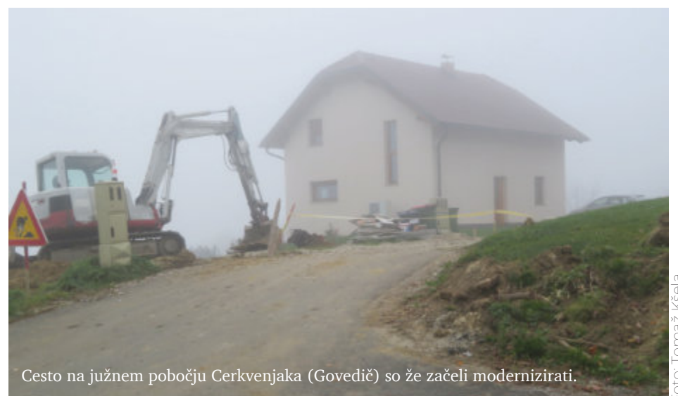
Cesto na južnem pobočju Cerkevjaka (Govedič) so že začeli modernizirati.

tej lokaciji, kos zemljišča pa je odkupilo tudi gradbeno podjetje, ki bo na njem zgradilo dva stanovanjska bloka s po 12 stanovanji. Skupaj jih bodo torej zgradili 24. Za to, da bodo lahko začeli graditi novo stanovanjsko naselje, mora občina najprej zgraditi dovozno cesto do omenjenega zemljišča. Izgradnja se je že začela, kar dokazuje tudi naša fotografija.