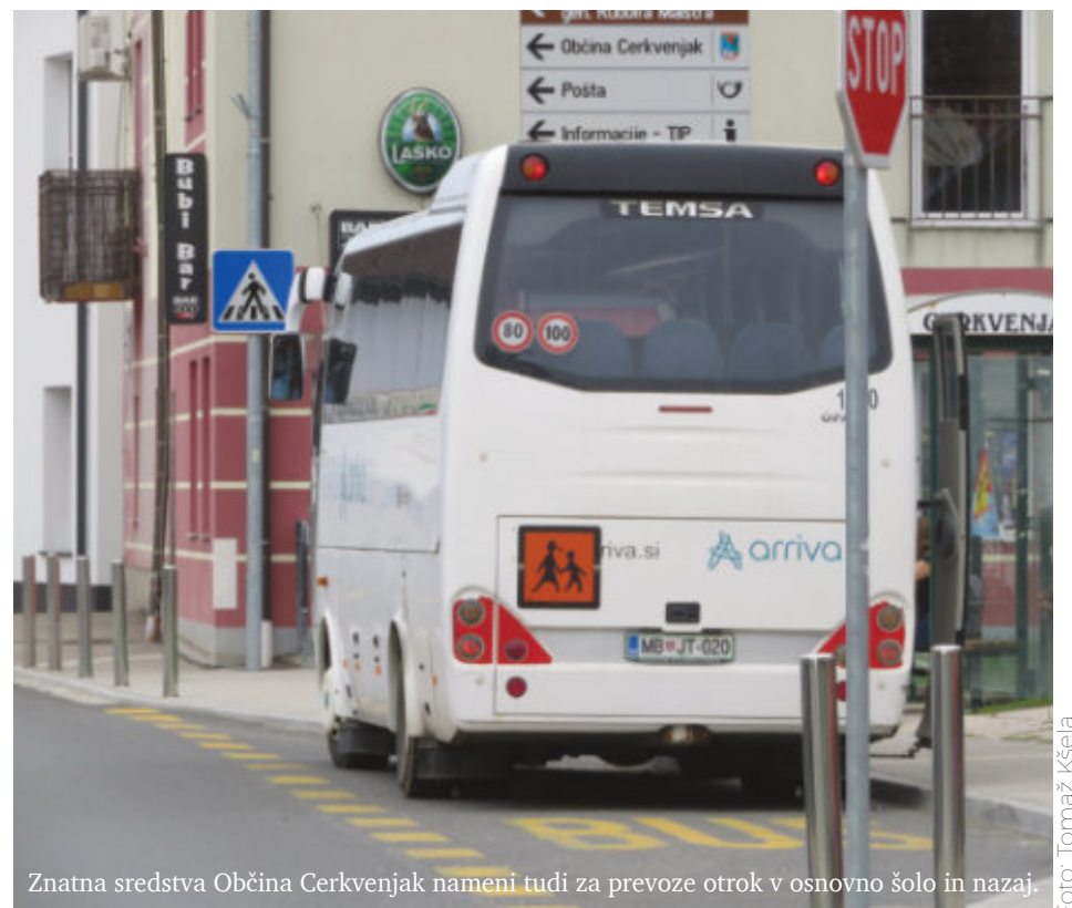
Znatna sredstva Občina Cerkvenjak namenijo tudi za prevoze otrok v osnovno šolo in nazaj.

Za socialno varstvo, zlasti mladih družin, starejših, socialno šibkih, telesno in duševno prizadetih, zasvojenih in drugih