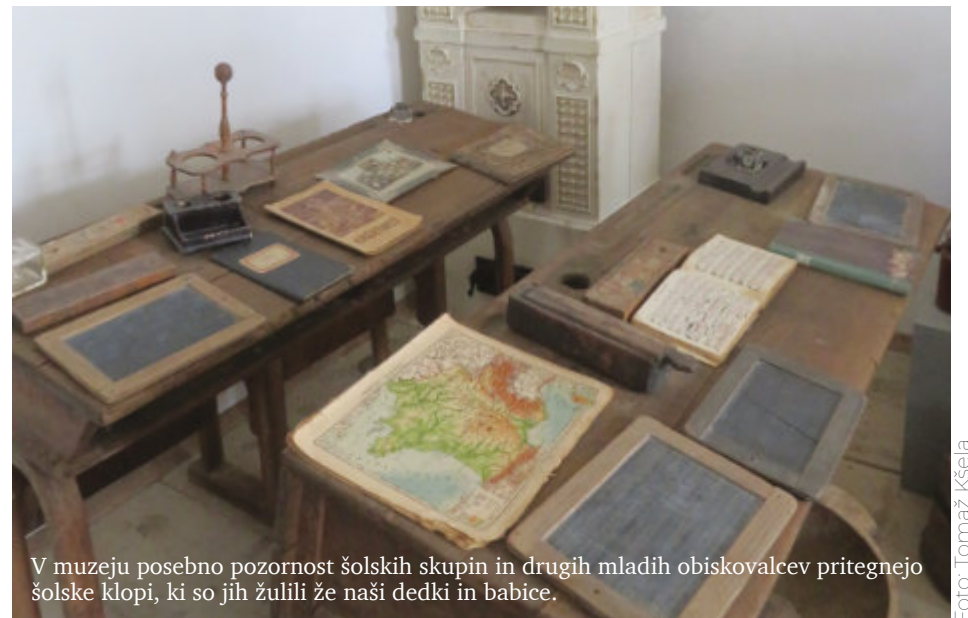
V muzeju posebno pozornost šolskih skupin in drugih mladih obiskovalcev pritegnejo šolske klopi, ki so jih žulili že naši dedki in babice.