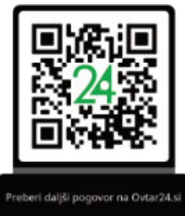
Preberi daljši pogovor na Ovtar24.si

Podiplomskega študija vsaj takoj po Harvadu ne načrtujem. Mislim, da bi rada pridobila nekaj izkušenj dela, preden se vrnem v šolske klopi. Ostaja veliko neznank glede lokacije ali celo področja dela, kjer bi se rada preizkusila. Ne glede na področje vem, da potrebujem delo, ki me kreativno izzove. V sebi čutim še ogromno neizživetih kreativnih vizij, ki bi jih rada delila s svetom. Zelo se zanimam za gledališče, glasbo, šolstvo, znanost in literaturo. To, kje in kako bom te strasti kombinirala, pa je za zdaj skrivnost tudi zame.