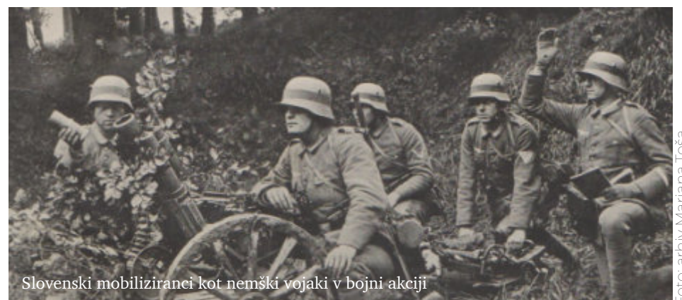
Slovenski mobiliziranci kot nemški vojaki v bojni akciji