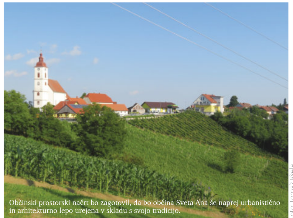
Občinski prostorski načrt bo zagotovil, da bo občina Sveta Ana še naprej urbanistično in arhitekturno lepo urejena v skladu s svojo tradicijo.

Občinski prostorski načrt je na kratko nemogoče predstaviti, saj obsega 92 na drobno tipkanih strani in številne priloge. Poleg splošnih ciljev prostorskega razvoja dokument ureja tudi podrobnosti, ki jih morajo upoštevati vsi. Za primer si denimo oglejmo, kaj piše o fasadah hiš: te morajo biti v pastelnih in svetlih barvah ter ne v kričeh. Strešne kritine morajo biti opečne, črne, sive ali druge temne barve. Minimalni naklon streh, če niso ravne, mora biti 30 stopinj. Dokument natančno opredeljuje tudi, kje in za kakšne potrebe je mogoče graditi pomožne objekte, ter celo to, kako visoke in kakšne so lahko ograje med sosedi. Vse je natanko določeno, tako da bo razvoj Svete Ane, ki je že danes lepo urejena, še naprej skladen in usklajen s potrebami in interesi vseh.