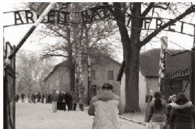
Taborišče Auschwitz-Birkenau vedno znova pretresa obiskovalce.

Na grozodejstva 2. svetovne vojne so se učenci spomnili preko zgodb, z igrami vlog, s slikovnim gradivom in preko pesmi. Dotaknili so se zgodbe o židovskem pianistu, ki je