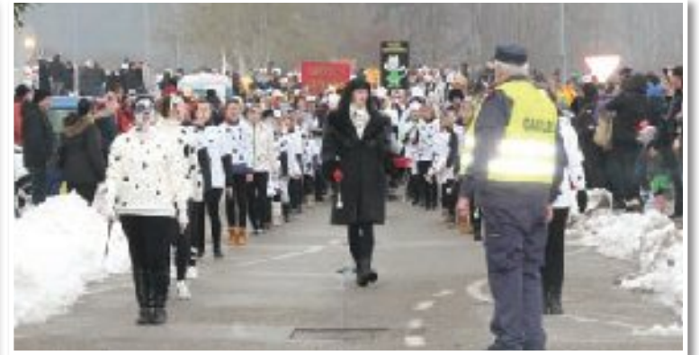
Lenarske mažoretke so se za pusta prelevile v krotke dalmatince.