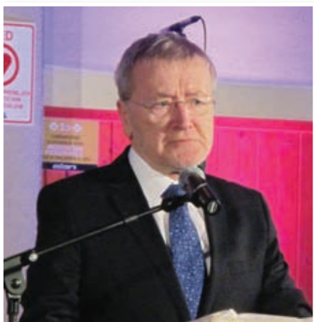
Dr. Dušan Keber: Rdeči križ je največja humanitarna organizacija na svetu.