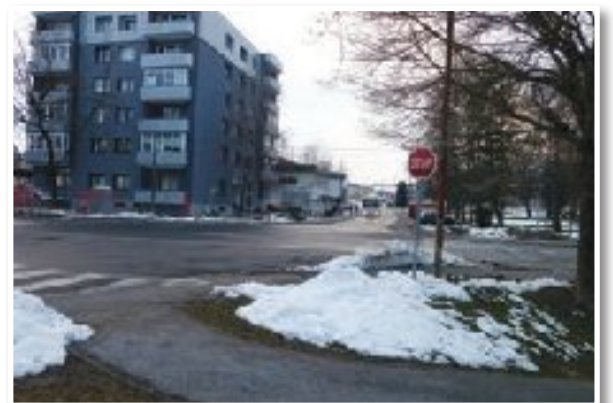
... in pri avtobusni postaji.