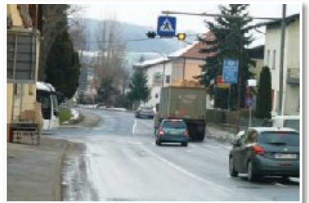
Krožišče bo tudi ob stari lekarni ...