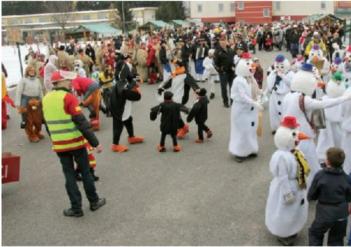
Pri Lenartu so pripravili že 27. pustno povorko, v kateri je sodelovalo okrog 1400 maskar iz domače in drugih občin. Njihov pohod je navdušeno spremljala množica obiskovalcev (str. 12).