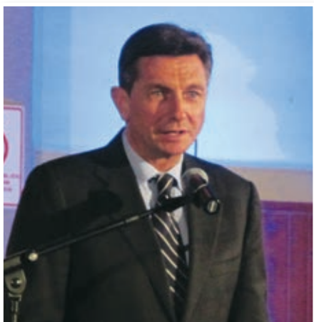
Borut Pahor: Potrebujemo eden drugega, pa ne samo v času krize.