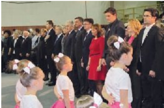
Proslave ob 70-letnici OO RK Benedikt se je udeležil tudi njen častni pokrovitelj, predsednik republike Borut Pahor.