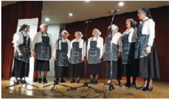
Nastop ljudskih pevck KD Sveta Ana