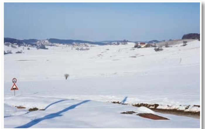
Sicer idilična zima načenja občinski proračun.