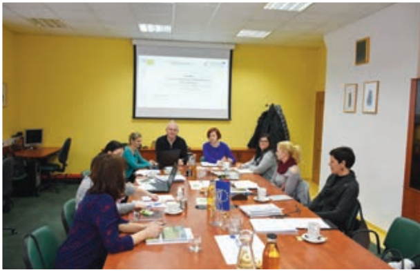
Udeleženci 3. koordinacijskega sestanka Escape 7. 2. 2018