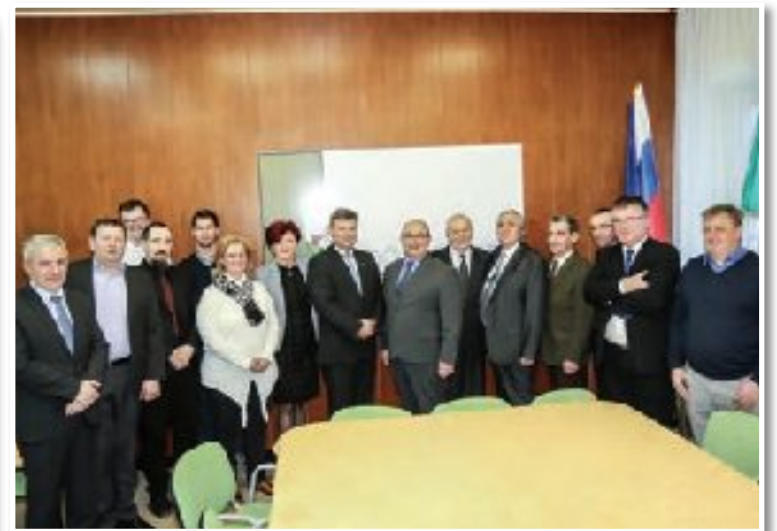
Lenart je sredi februarja obiskala ekipa ministrstva za infrastrukturo. Občini očitno uspeva pravi preboj na področju cestne infrastrukture (str. 5).