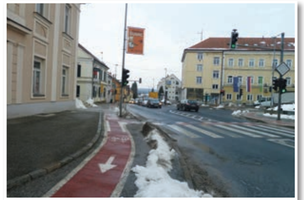
Na osrednjem križišču bo krožišče