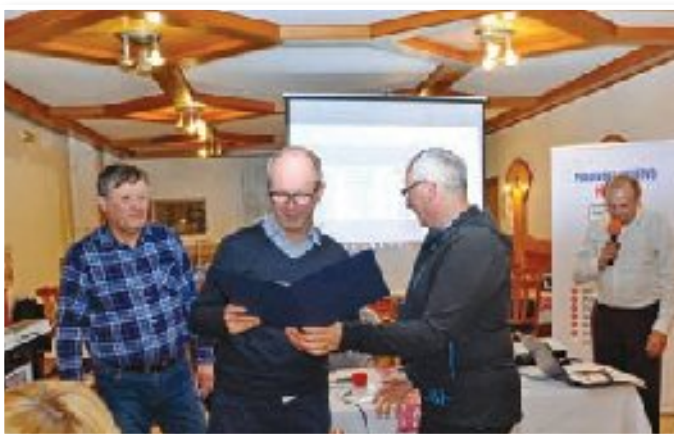
Podelitev priznanj članom