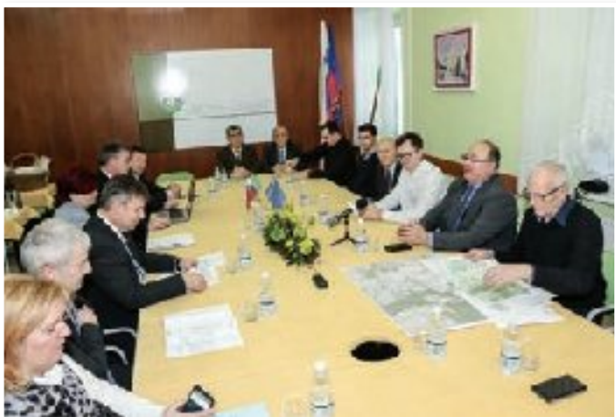
Pogovor v občinski sejni sobi