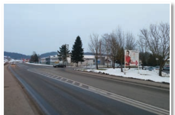
Na odcepu za Sv. Trojico bo poslej krožišče.