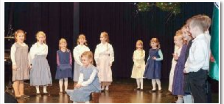
Po vseh osrednjih Slovenskih goricah so ob slovenskem kulturnem prazniku pripravili proslave (str. 8). Utrinek z lenarske.