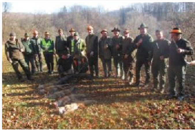
Pozdrav lovini – simbolično slovo divjadi od lovišča

lovih na lisice v mesecu januarju, ko so ostali lovi končani.