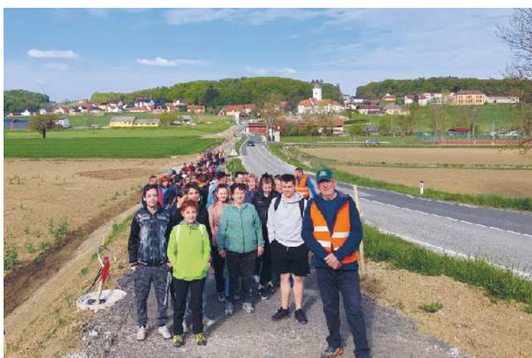
Na petnajst kilometrsko pot se je podalo več kot 120 pohodnikov.