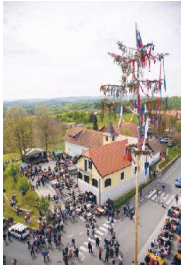
Zavrha ohranita slovenskogoriška kultura in stavbna dediščina.