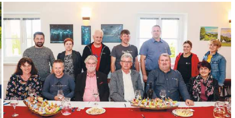
Sodelujoči na izboru Jurjevega vina 2023.