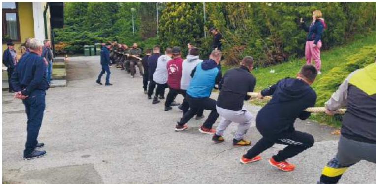
Pokal ostaja v rokah Lovske družine Sv. Jurij Jurovski Dol