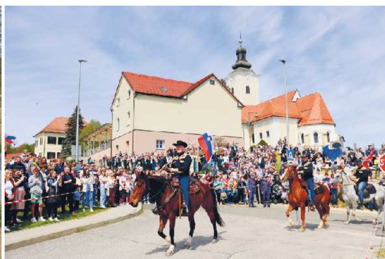
Jurjeva nedelja je bila odlična obiskana tudi zaradi lepega vremena.