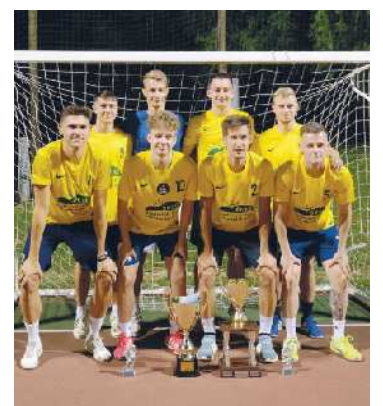
Lanskoletni zmagovalec lige je bil ŠKSG - Študentski klub Slovenskih goric.

Društvo mladih Jurovski Dol tudi letos organizira Poletno ligo v malem nogometu 2023, ki se bo odvijala na igrišču pri OŠ Sv. Jurij v Slovenskih goricah. V društvu vse nogometne navdušence vabijo, da se jim pridružijo pri navijanju petkovih tekem in se okrepcajo z legendarnimi hotdogi. Skupaj ustvarite nepozabno vzdušje in podprite vaše favorite na poti do zmage! Termini lige so: 26. maj, 2. junij, 9. junij, 16. junij, 23. junij in 30. junij. Pričetek tekem je predviden ob 19. uri.