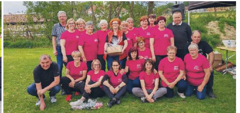
Organizatorji kmečkih iger so se ponovno izkazali.