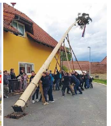
Postavljanje majpana v Jurovskem Dolu.