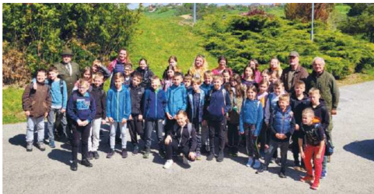
Delavnice z domačimi lovci so se udeležili učenci 4. in 5. razreda.