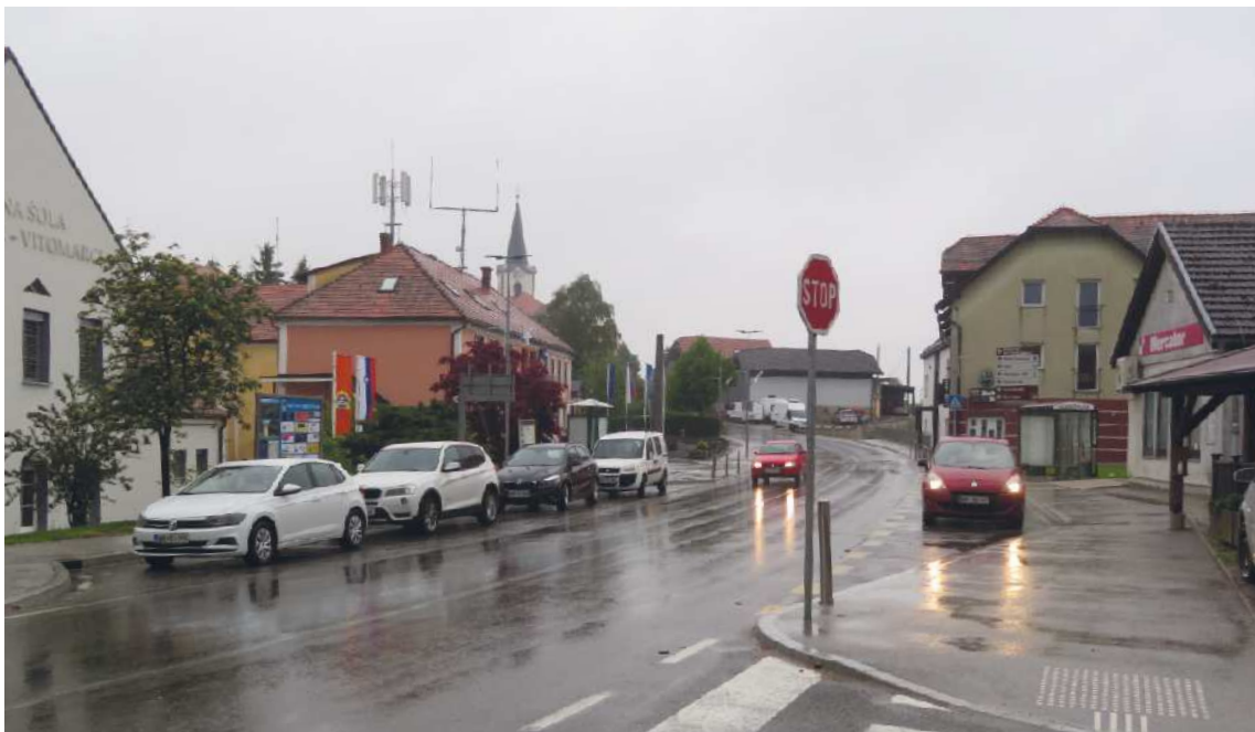
Veduta Cerkvenjaka nekoč in danes

več. Gradbeno dovoljenje za širitev vrtca je občina že pridobila.