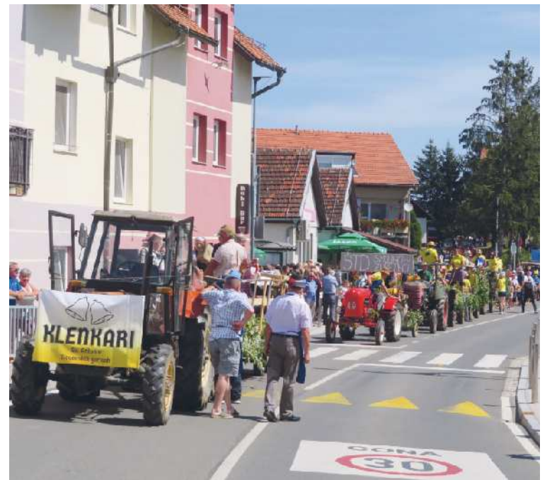
Utrinek z lanskoletne povorke »Obudimo stare čase«, ki vsako leto pritegne v Cerkvenjak veliko obiskovalcev.

V Ovtarjevih novicah je premalo prostora, da bi lahko bralce opozorili