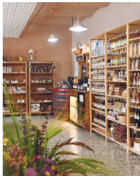
Trgovina Dobrote Dolenjske v Trebnjem.

Odhod avtobusa bo ob 6. uri izpred ŠRC Polena. V Trebnjem nas bo pričakala strokovna turistična vodnica, ki bo naša spremljevalka in neskončen vir informacij in zanimivih zgodb. Po sladkem zajtrku – Baragovi rezini, kavi in vodi – sledi strokovno vodeni ogled edinstvene Galerije likovnih samorastnikov Trebnje , osrednje ustanove za naivno umetnost v Sloveniji. Nato bomo odkrivali in raziskovali kulinarčno dediščino Dolenjske, ki je edina slovenska pokrajina z izdelano gastronomsko strategijo, kulinarčno piramido in prvim regionalnim kulinarčnim zemljevidom v Sloveniji. Dobrote Dolenjske so kolektivna blagovna znamka, ki nastaja pod okriljem Zavoda za kulinariko in turizem Dobrote Dolenjske. Oglevali si bomo še druge zanimive projekte, ki so bili izvedeni pod okriljem LAS STIK: Sitarjevo hišo v Dolenjskih Toplicah , Središče gastronomije Dolenjske, Poslovne priložnosti na podeželju. Zadnja točka ogleda pa bo grad Žužemberk , ki je ena najslavnejših in tipičnih srednjeveških trdnjav na Slovenskem. Njegovi ostanki se mogočno dvigajo na strmih skalovju nad reko Krko. Na koncu nas čaka