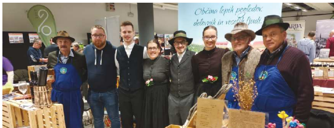
Na stojnico so mimoidoče z glasbo in plesom privabljali tudi člani Folklorne skupine Sveta Ana.