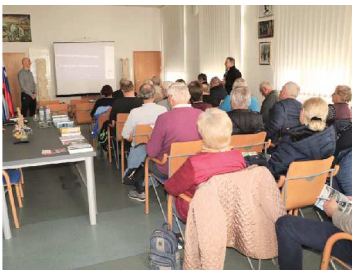
Starši vozniki in voznice so na seminarju osvežili svoje znanje o pravilih v cestnem prometu.