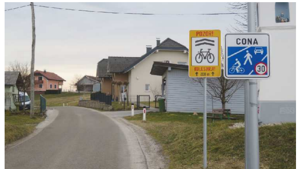
Ureditev kolesarske skozi Čagono ne bo upočasnila prometa, saj je bil ta že doslej na željo prebivalcev na več odsekih omejen na 30 kilometrov na uro.

prihodnje omejena na 40 kilometrov na uro, kar bo povečalo varnost v cestnem prometu, še zlasti varnost otrok in starejših pešcev. Ceste po slemenih v Slovenskih goricah, ki praviloma niso širše od 3,5 metra, so že tako v prvi vrsti namenjene za »počasen« lokalni promet oziroma za dovoz stanovalcev do svojih domačij in ne za tranzitni promet. Zanj je na voljo dovolj državnih cest – tudi na relaciji Cerkvenjak–Vitomarci.