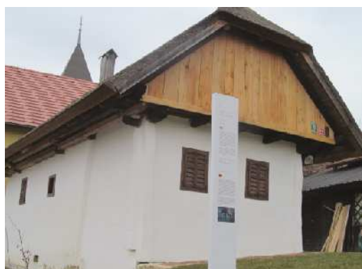
Urejena cimprača v Zavrhu bo maja odprla vrata

Obnovljena in urejena cimprača v Zavrhu je še en dokaz skrbi lokalne skupnosti za ohranjanje kulturne dediščine. Nova pridobitev bo vključena v lenarško turistično ponudbo, saj je takšnih ostankov arhitekturne dediščine v tem delu Slovenskih goric izjemno malo. Pred časom so že bile aktualne tudi nekatere pobude, da bi v njej uredili manjši viničarski