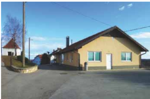
Obnovljena ambulanta v Cerkevniku čaka na prihod zdravnika