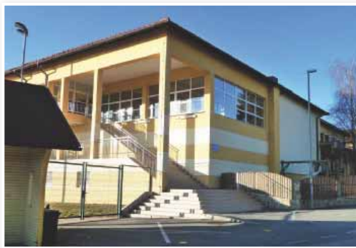
Šola za vrtcem

V občini Sveta Trojica so leta 2010 za ogrevanje in pridobivanje toplotne energije v individualnih hišah in večstanovanjskih objektih potrošili okoli 347 tisoč litrov kurilnega olja, okoli 19.500 litrov utekočinjenega naftnega plina, 17 ton premoga in skoraj 1.100 kubičnih metrov drv.