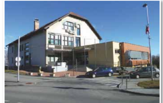
Ekošola in vrtec spodbujata projekte za varovanje okolja in zdravo hrano

Razveseljev je tudi podatek, da je športna dvorana zelo zasedena, kljub podaljšanemu urniku obratovanja s 45 na 60 minut. »V tem lahko vidimo upravičenost objekta in namen-