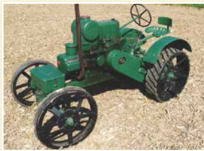
Eden najstarejših traktorjev Svoboda iz leta 1937

Partnerja LAS-ovega projekta sta občina Benedikt ter Zgodovinsko društvo Slovenske gorice.