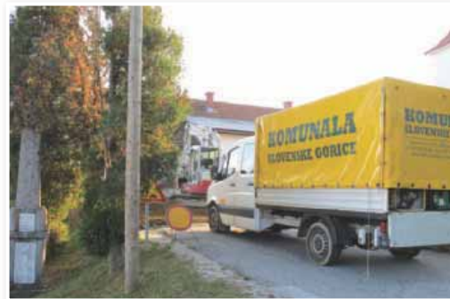
Kljub krizi imajo delavci podjetja Komunala Slovenske gorice še polne roke dela, kar kaže na to, da dela opravijo kakovostno

Podjetje, ki zaposluje okoli 65 delavcev, je lansko leto ustvarilo okoli 6,5 milijona evrov prihodkov. Podjetje kar 99 odstotkov dela pridobi na javnih razpisih. Lani so med drugim izvajali več za naše razmere velikih projektov. Gradili so vodovod v okviru projekta Celovita