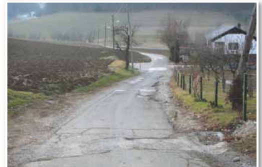
Novo asfaltno prevleko bo v letošnjem letu dobil Lešnikov klanec, katerega cestišče je že zelo načeto

Poleg že omenjenih projektov in rednih mesečnih transferjev (šolstvo, sociala, zdravstvo ...), ki jih je občina po zakonu dolžna izvajati in plačevati, bodo manjša popravila oz. obnove opravljene tudi v mrljiški vežici. Novo podoba pa bo Jurovski Dol kazal tudi ob vstopu v sam center, saj bodo uredili tudi obzidja pri starem pokopališču.