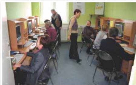
Dobimo se v računalnici

»Smo starejši, nismo pa stari. Nismo brez