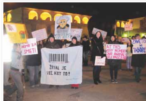
Medtem ko je na Trgu Leona Štuklja potekala otvoritvena slovesnost, so na Trgu svobode potekale demonstracije, na katerih so vzklikali: »Maribor, prestolnica korupcije.«