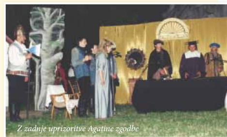
Z zadnje uprizoritve Agatine zgodbe

Projekt bo eden največjih v zgodovini igralskega Slovenskih goric, zato moramo stopiti skupaj odgovorni, prilagodljivi in vztrajni ljudje, kulturniki z dušo na pravem mestu!