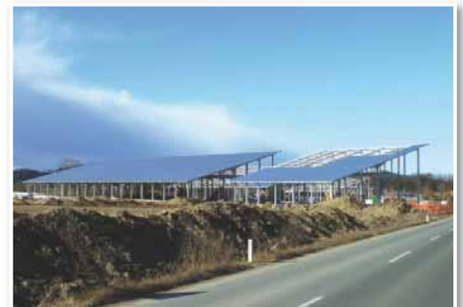
Elektrika iz sončne elektrarne je vse bližja

Zemljišče, ki je namenjeno industrijski coni, kjer se trenutno odvija intenzivna gradnja sončne elektrarne, je v treh četrtinah že prodano, pred kratkim je bila prodana parcela v izmeri 5000 m 2 , ker pa pogodbe še niso podpisane, bomo o novem investitorju brali v naslednji številki. Nekaj manjših parcel je še na razpo-