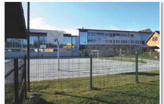
Zunanji športni prostori in športna dvorana v središču Benedikta

Skupno bo občina za sofinanciranje športa po letnem programu športa namenila 38.000