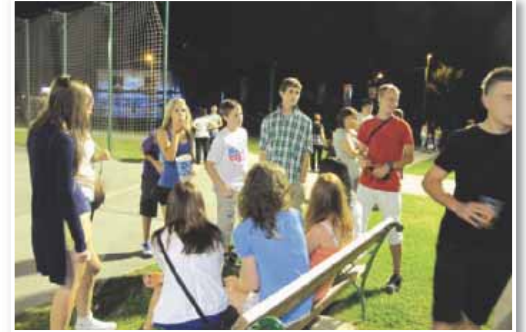
Občina Benedikt, v kateri je veliko otrok in mladine, vzorno skrbi za razvoj športa

Športne prireditve bo občina sofinancirala s