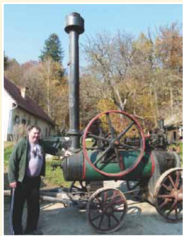
Lokomila Hofherr Schrantz iz leta 1922

V Benediktu sta 27. 12. 2011 v okviru projekta Kmetijska tehniška dediščina, ki ga je izvajal Klub Starodobnik Slovenske gorice, izšla Elaborat o pripravi muzejske zbirke starih traktorjev in druge kmetijske tehniške dediščine v osrednjih Slovenskih goricah ter publikacija Tehniška dediščina (katalog izbranih starih traktorjev in druge kmetijske tehniške dediščine v osrednjih Slovenskih goricah) v tiskani in elektronski obliki. Informativni in vzgojni namen projekta je tudi predstavljen na dveh panojih, ki sta razstavljena v Avli Jožeta Hudalesa v Lenartu.