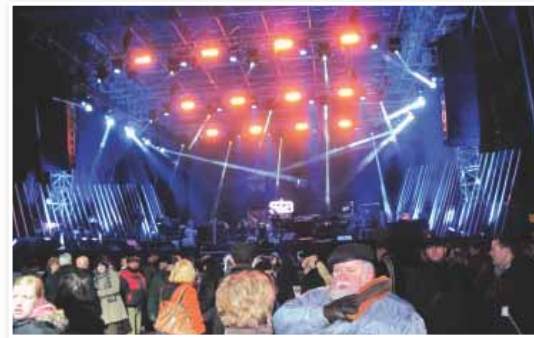
Maribor je postal »Evropska prestolnica kulture 2012« z veličastno otvoritveno prireditvijo na Trgu Leona Štuklja v središču mesta