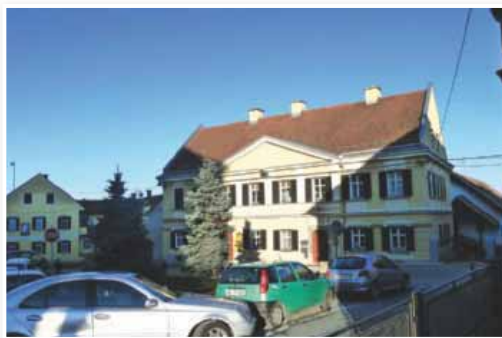
Ogrevanje javnih in zasebnih objektov terja veliko energije

Največji delež toplotne energije, kar 95 odstotkov, porabijo v stanovanjskih objektih. Večja podjetja predstavljajo en odstotek porabe energije, javni objekti pa 4 odstotke. Za ogrevanje v največji meri uporabljajo kurilno olje (49 odstotkov), sledijo pa mu biomasa – v glavnem drva (44 odstotkov), utekočinjen naftni plin in električna energija.