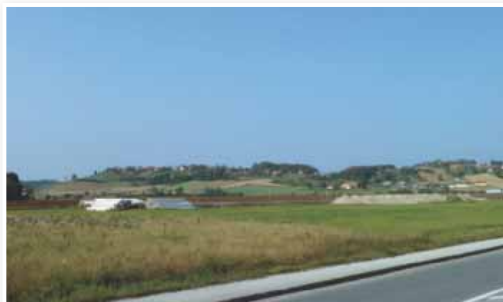
Nova poslovno industrijska cona

»Proračun za leto 2012 je težak 19 milijonov evrov. Od tega seveda moramo odšteti investicije, ki so povezane z izgradnjo vodovodnega sistema v okviru celovite oskrbe SV Slovenije s pitno vodo za skupino občin. Ker je občina Lenart koordinatorka projekta, gre celoten finančni del preko lenarškega občinskega proračuna. Njegova vrednost je okrog 9,5 milijona evrov. Ta znesek moramo odšteti od samo lenarškega proračuna. Proračun občine Lenart za leto 2012 je tako težak nekaj manj kot 10 milijonov evrov.«