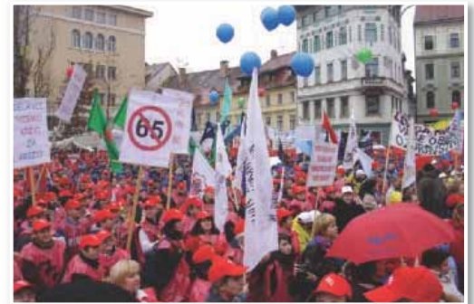
Tako so pred leti delavci iz vse Slovenije na Prešernovem trgu v Ljubljani demonstrirali za dvig minimalne plače

davčna zakonodaja, saj se delavcem pri določeni bruto plači z dvigom bruto plače zmanjša neto plača. Tako denimo pri povečanju bruto plače iz 860 evrov na 870 evrov delavec izgubi kar 20 evrov neto plače na račun splošne olajšave, ki se mu zniža za 167 evrov. Šele pri bruto plači v višini 910 evrov se izniči vpliv znižane splošne olajšave. Enako se zgodi zaposlenim, ki se jim bruto plača poveča iz 997 evrov na