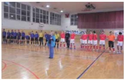
Tudi tokratni derbi med Slovenskimi goricami in Benediktom postregel z zanimivim obračunom, številnimi zadetki in kartoni