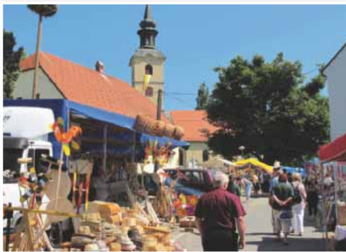
V občini Benedikt sistematično postavljajo temelje za bodoči turistični razvoj občine, ki bo po izgradnji Term Benedikt postala turistični biser Slovenskih goric

turističnem vodenju. Za občino Benedikt, v kateri bodo prej kot slej začeli graditi Terme Benedikt, so vsi dokumenti, ki podpirajo in