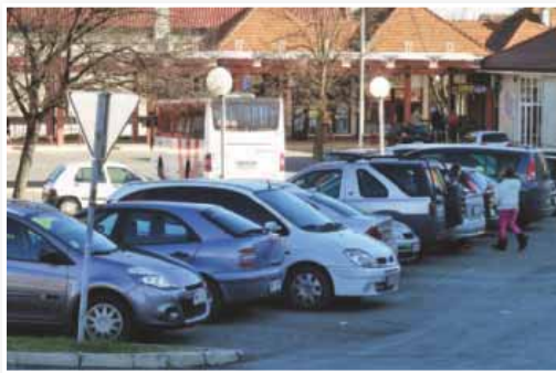
Lenarska parkirišča so v glavnem polna, redarji nadzorujejo parkiranje na nedovoljenih mestih

Oba skupna občinska organa so ustanovile iste občine ustanoviteljice, zato njune službe delujejo na istem teritorialnem območju. Zato se je porodila ideja, da bi obe službi združili in s tem zmanjšali stroške za njuno delovanje.