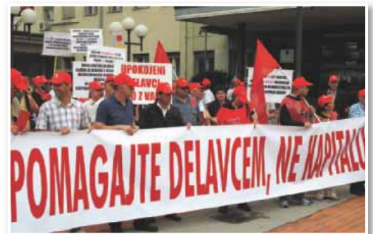
Presoja ustavnega sodišča o odpisu oziroma odlogu plačevanja prispevkov je zahtevala Zveza svobodnih sindikatov Slovenije

odpis, odlog ali obročno odplačevanje prispevkov za zavarovanje v nasprotju z določbami slovenske ustave in da pomeni nedopusten poseg v pravico delavca. Odločitev ustavnega sodišča pomeni velik korak naprej v priznavanju pomena in vloge prispevkov v si-