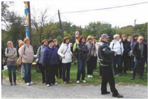
Turisti iz Dolenjske

Turistično društvo Sv. Ana je več kot uspešno zaključilo lansko leto, saj je kraj z enodnevnim izletom spoznavalo 60 avtobusov turistov iz vseh koncev Slovenije. Ob vsem tem so poizkusili odlične domače dobrote ter vrhunska vina domačih vinogradnikov. Da pa se v društvu trudijo, pove podatke, da razmišljajo o turizmu z namestitvenimi kapacitetami.