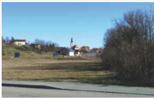
Čakajoča investicija ob lenarški vpadnici