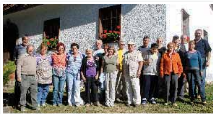
Udeleženci 5. Kolbičeve kolonije

Likovna sekcija Kulturno umetniškega društva Gabrijel Kolbič z Zgornje Velke je 1. oktobra že petič pripravila delovno srečanje likovnic in likovnikov na tradicionalni enodnevnih koloniji. V Methansovi hiši se je zbralo 23 ustvarjalcev in ustvarjalcev: osem članic in članov domače likovne sekcije in 15 gostov iz Slovenskih goric in oddaljenih koncev, tudi iz Madžarske.