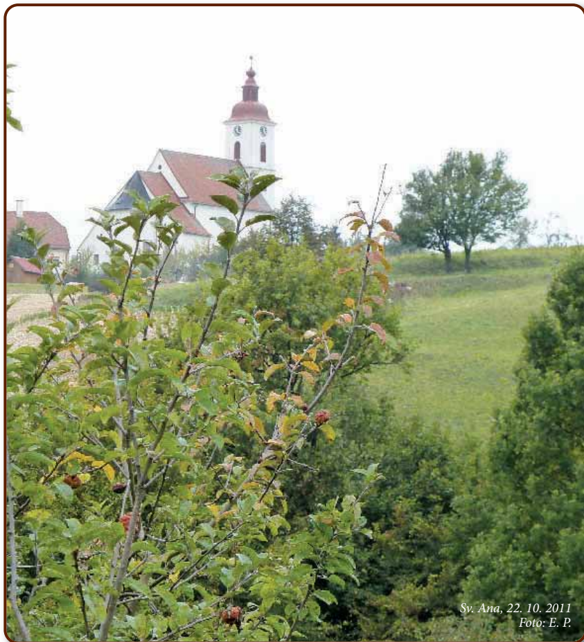
Sv. Ana, 22. 10. 2011