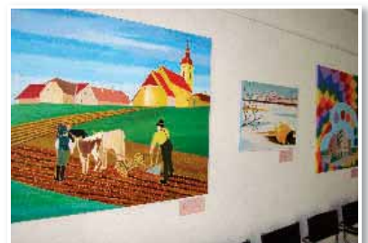
E. P.

šole, je že sodeloval na raznih likovnih natečajih in razstavah in bil nagradjen. Tokrat prvič predstavlja tudi slike na platnu.