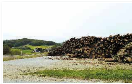
Deponiji v Močni

Les poskušamo zagotavljati predvsem iz domačega okolja, tako da manjvreden les tudi