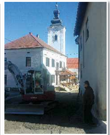
Župan občine Sv. Jurij v Slov. gor. ob ogledu poteka del obnove vaškega jedra