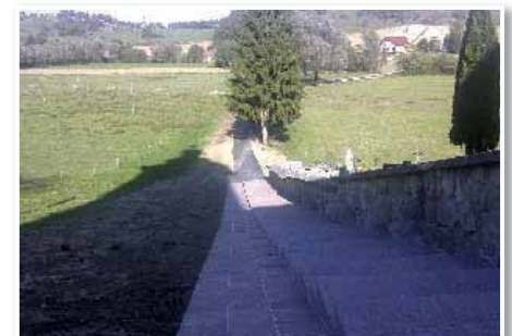
Povezovalna potka od osrednjega trga do športnega centra v Jurovskem Dolu je že dobila novo podobo

Kljub težavam, ki jih občinam pri investicijah povzročata 23. člen zakona o sofinanciranju občin, o čemer smo pisali že v prejšnji številki Ovtarjevih novic, so se na občini Sv. Jurij v Slov. gor. uspeli dogovoriti s Cestnim podjetjem Murska Sobota (slednje deluje znatraj podjetja Pomgrad) o pričetku del na 1630 m dolgem cestnem odseku cesti Močna-Zg. Partinje-Jakobski Dol. Župan občine Sv. Jurij v Slov. goricah zagotavlja, v kolikor bo vreme v prihodnjem mesecu kolikor toliko vzdržalo, se bodo uporabniki te ceste lahko še v tem letu zapeljali po novi asfaltni podlagi.