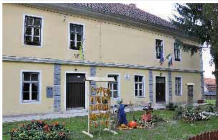
Otroci z vzgojiteljicami in učiteljicami so prijetno poživali jesenski čas pred podružnično šolo v Lokavcu, kjer obiskujejo vrtec oz. šolo