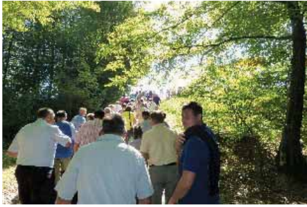
Zgornje Podravje obišče vsako leto več turistov

bogato kulturno dediščino, številnimi vrhunskimi kulturnimi in športnimi prireditvami ter možnostmi za rekreacijo. Za oblikovanje celostne turistične in gastronomske ponudbe je pomembno tudi, da ima turistično območje svoj vinorodni okoliš in kakovostno kulturno ponudbo.