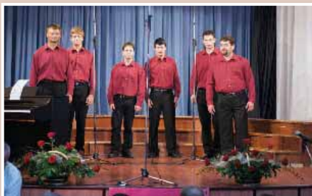
Nastop Slovenskogoriških glasov na Orfejevi pesmi 2011

Izvedbo koncerta, ki bo potekal kot ena izmed prireditev ob občinskem prazniku občine Lenart, sta omogočila občina Lenart in JSKD Lenart.