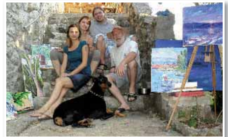
Udeleženci likovnih snovanj na Krku so (pre)polni načrtov