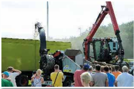
Drobljenje lesa – s prikaza na sejmu KOS 2011 na Poleni

odkupujemo od lokalnih lastnikov gozdov. Ocenjujemo, da se lastniki gozdov še niso povsem vključili v proces gospodarjenja z goz-